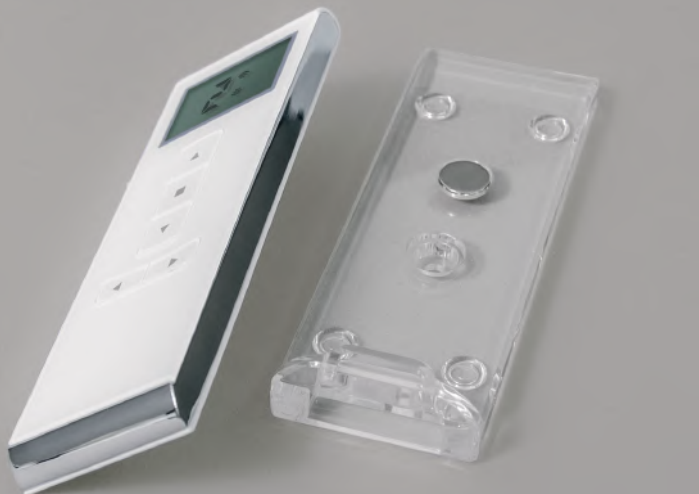
Pilot z wyświetlaczem AURORA 15-kanałowy, biały (AURORA_15R)

1. Sterowanie: możliwość sterowania 1 napędem bądź grupą do 20 napędów na każdym kanale