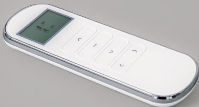
Pilot z wyświetlaczem AURORA OVO 15-kanałowy, biały (AURORA OVO_15R)