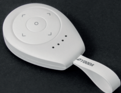
Pilot brelok QUATRO 4-kanalowy, biały (QUATRO_4Rk)